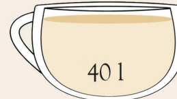
Kräuter- und Früchtetee