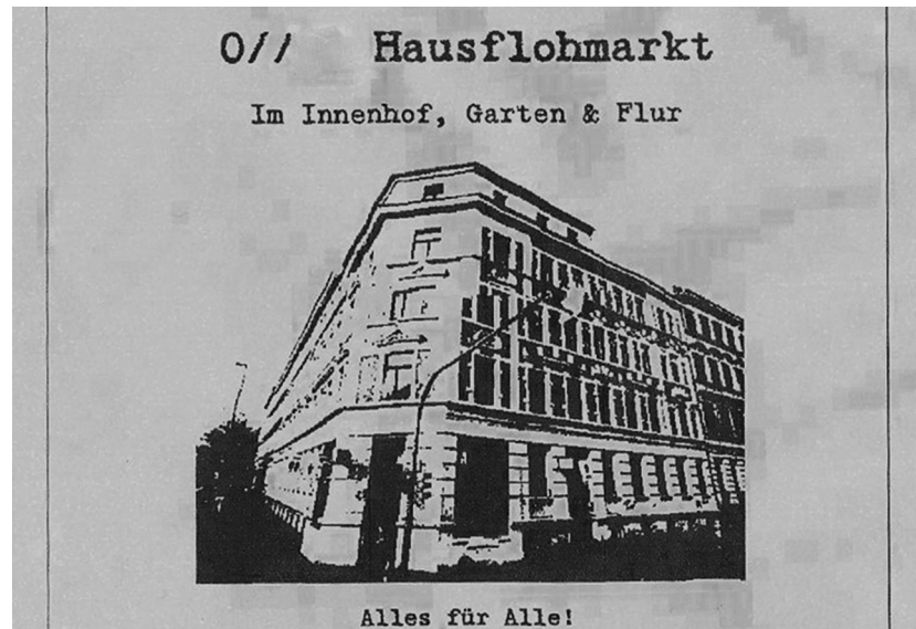
Foto eines alten Flyers zu einem der Projekte des Hauses (Ausschnitt)

Zitat von Thomas von Aquin: http://zitate.net/thomas%20von%20aquin.html