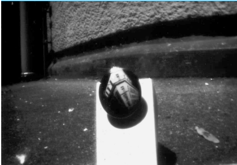
Lochkamerafotografie des Ansteckers im Zugangsbereich zum Keller

Um die Veranstaltungen im hauseigenen Keller nicht ausarten zu lassen – schließlich versteht man sich nicht als öffentliche Diskothek – und gleichzeitig Freunde und Bekannte einzuladen ohne auf die Nutzung von Flyern und Web angewiesen sein zu müssen, entwarf man jeweils »Türöffner«. Entweder eigens gestaltete Eintrittskarten, Festivalbändchen oder derartige selbstproduzierte Anstecker. Diese wurden an die Leute verteilt und gewährten ihren Trägern den Einlass zu feinstem Keller-Geschaller der aktuellen DJ-Cuisine. .