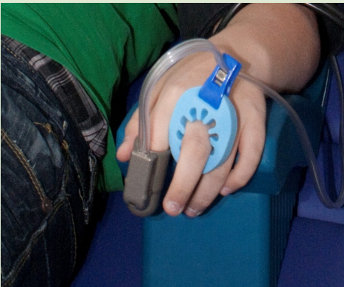
Pulswellenmessung am Finger

Wie bei der Blutdruckmessung wird mit einer Blutdruckmanschette am Oberarm eine Blutstauung erzeugt und damit die Blutzufuhr am Unterarm kurzzeitig unterbrochen. Kinder empfinden dies oft als Schwerelosigkeit des Armes. Nach Lösen der Manschette kommt es zum Wiedereinströmen des Blutes in die Gefäße des Unterarms sowie als Reaktion auf die Blutunterbrechung zu einer Weitung der Gefäße (Reaktive Hyperämie genannt). Diese Gefäßerweiterung erzeugt wiederum eine Erhöhung des Pulswellenausschlages.