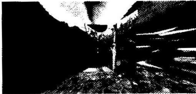
© Jürgen Meier (architektur&medien Leipzig): "El jardín de senderos que se bifurcan".