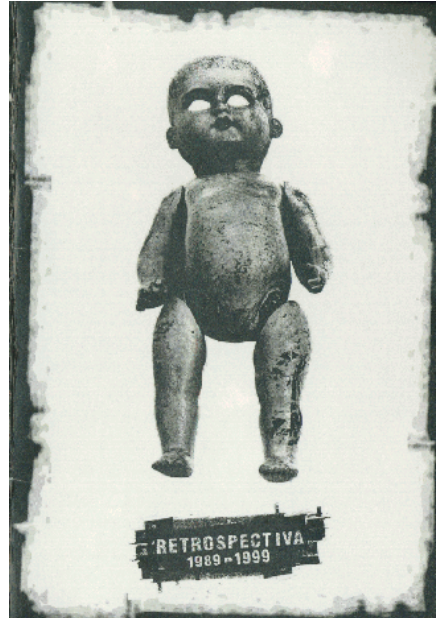
Programa de El Periférico de Objetos , © Periférico de objetos